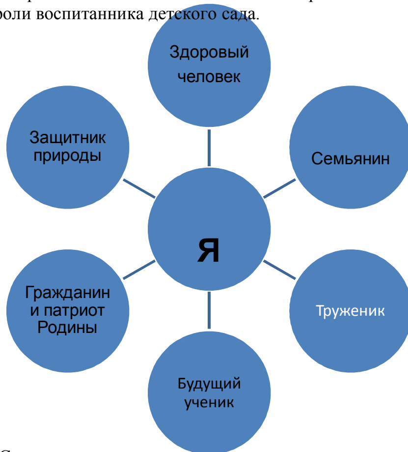
Рис. 1. Схема конечного результата воспитания согласно я-концепции.

Таковыми образами являются осознаваемые и принимаемые на практике социальные роли воспитанника детского сада.