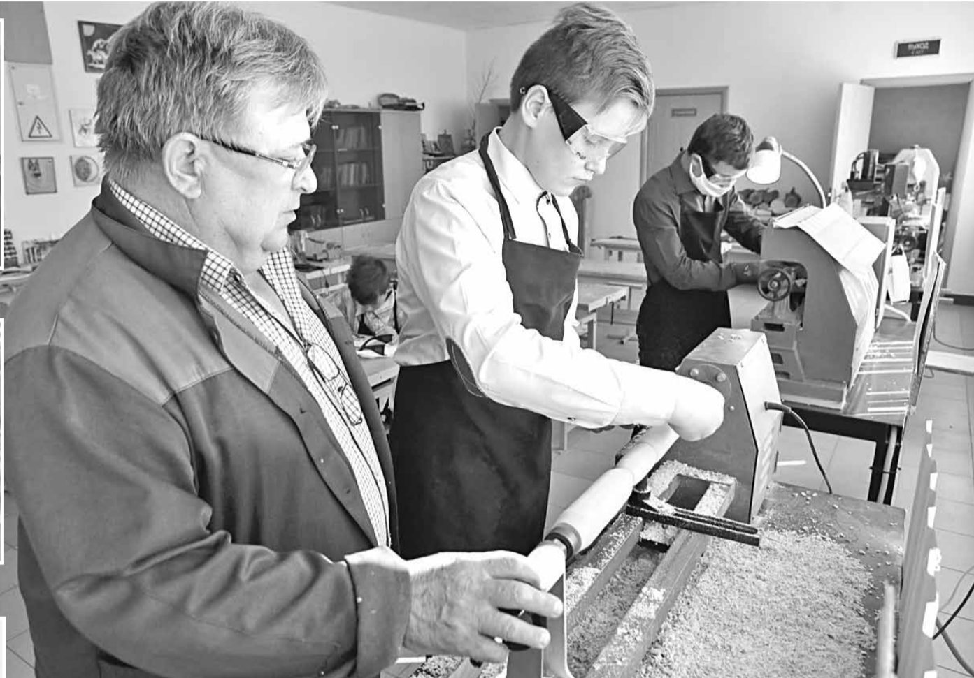
На уроке технологии в школьной мастерской