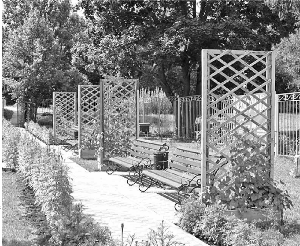
Вислудубравская школа Губкинского горокруга