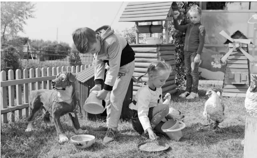
На «Фермерском двореке»