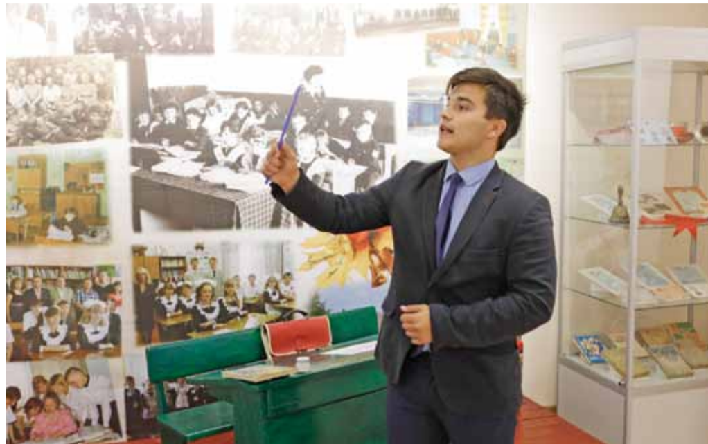
В музее Владимировской школы