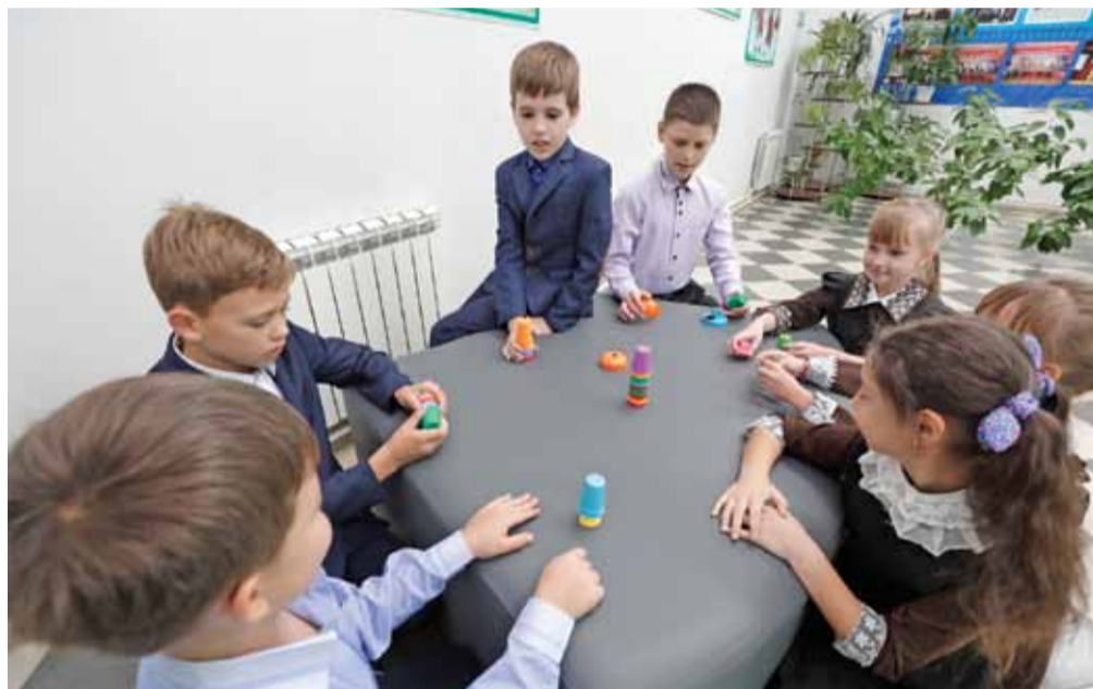
В художественно-эстетической зоне Верхопенской школы можно и проводить занятия, и играть