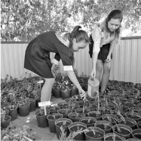
В школе выращивают растения с закрытой корневой системой