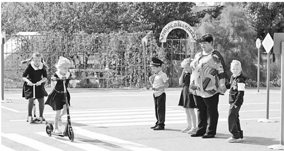
В «Автогородке» школьники на практике учат Правила дорожного движения

ЗА 45 ЛЕТ КЛИМЕНКОВСКАЯ ШКОЛА ВЫПУСТИЛА 575 УЧЕНИКОВ, 24 ИЗ НИХ НАГРАЖДЕНЫ ЗОЛОТЫМИ И СЕРЕБРЯНЫМИ МЕДАЛЯМИ, 30 СТАЛИ ПЕДАГОГАМИ (12 ИЗ НИХ ВЕРНУЛИСЬ ПРЕПОДАВАТЬ В РОДНУЮ ШКОЛУ).