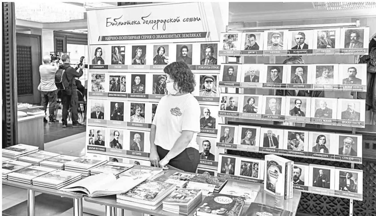
В последние годы в Белгородской области выпускается много качественных краеведческих книг, которые тоже можно изучать на уроках родной литературы

Задача нового предмета — познакомить школьников с произведениями фольклора, русской классики и современной литературы, которые не входят в список обязательных произведений, представленных в программе по предмету «Литература», но при этом максимально ярко воплотили национальную специфику русской литературы и культуры.