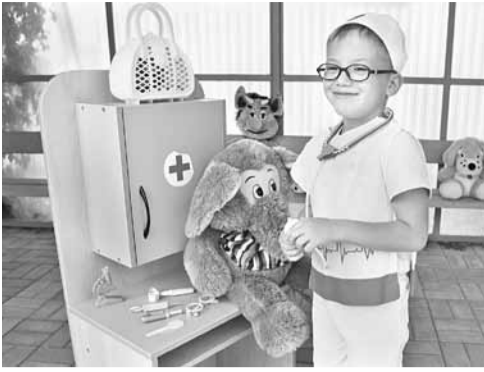
В «Ветклинике» дошколята печат плюшевых зверей