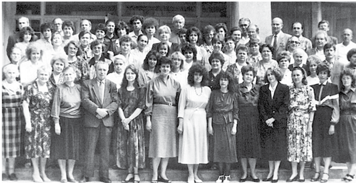
Коллектив Белгородского областного института усовершенствования учителей, 1994 год

Благодаря профессионализму, преданности своему делу, большому трудолюбию, таланту преподавателей, педагогов институт развивался, успешно выполняя свою главную миссию — повышать качество образования Белгородской области. Сегодня наш институт обладает высоким потенциалом, компетентным и работоспособным профессорско-преподавательским составом, который полон творческих планов и замыслов. Надеюсь, что всё это позволит нам эффективно реализовывать как региональные, так и федеральные инициативы. Желаю всем преподавателям и сотрудникам Белгородского института развития образования радости, профессиональных побед, счастья и любви близких, душевного равновесия, интересного и плодотворного учебного года!