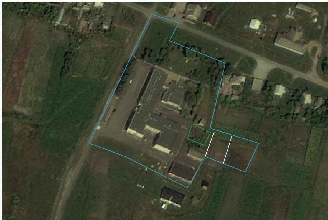
Схема территории МБОУ «Голубинская СОШ»